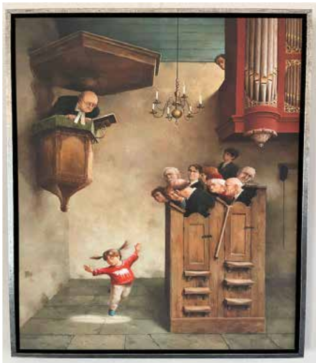
Dansje in de kerk

Marius van Dokkum ©2021 Art Revisited, Tolbert NL