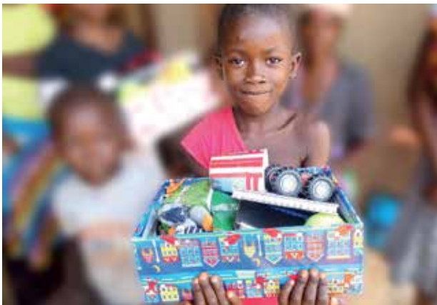
Diaconie Gapinge en Veere